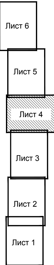
Схема расположения листов