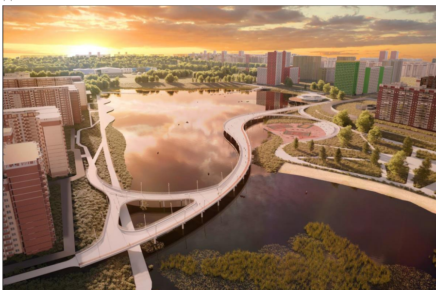
Рис. 1.2.1 Фрагмент концептуальных решений проекта благоустройства территории вокруг озера Черное

Министерством благоустройства Московской области разработана концепция обустройства территории и создания на ней зоны отдыха, которая после благоустройства может стать точкой притяжения, как для жителей Подмосковья, так и для москвичей. Концепцией благоустройства предусмотрено создание кругового велопешеходного маршрута. На благоустраиваемой территории появятся красивая набережная, пешеходные дорожки для прогулок вокруг озера, зоны активностей для детей, подростков, взрослых и пожилых людей.