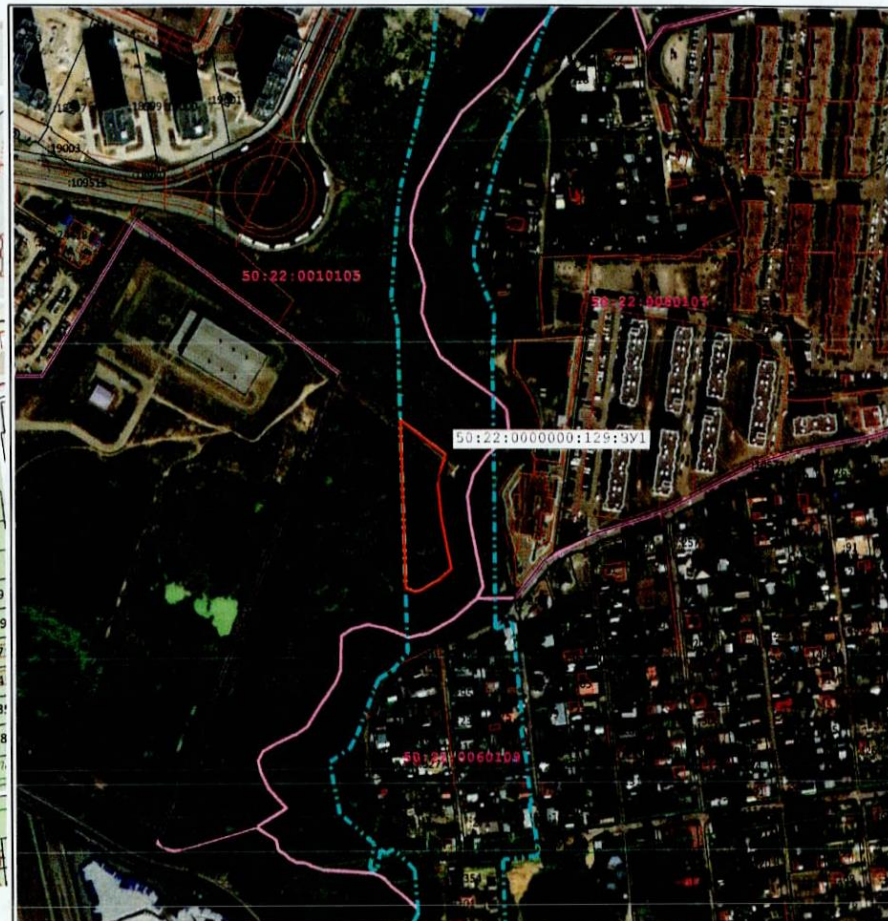
Масштаб 1:4 000