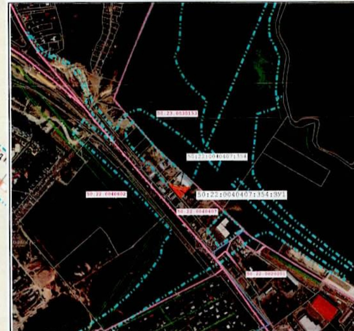
Масштаб 1:10 000