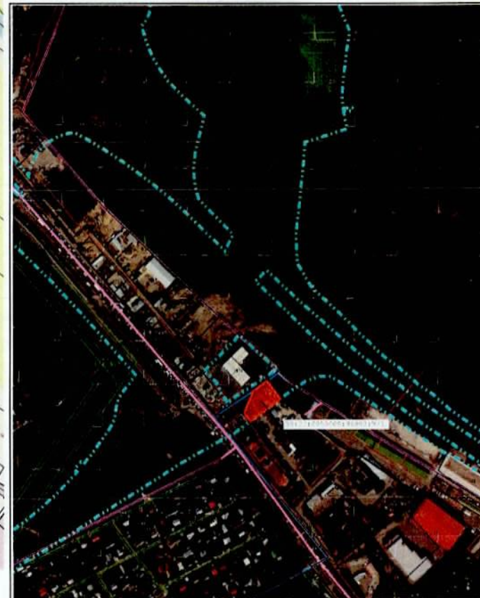
Масштаб 1:7 000